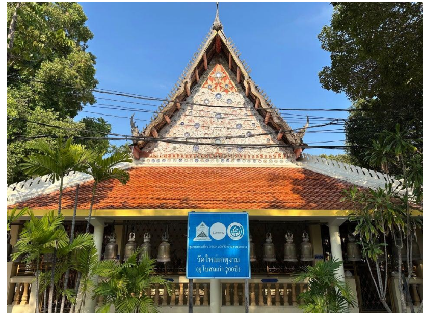
วัดใหม่เกตุงาม จังหวัดชลบุรี